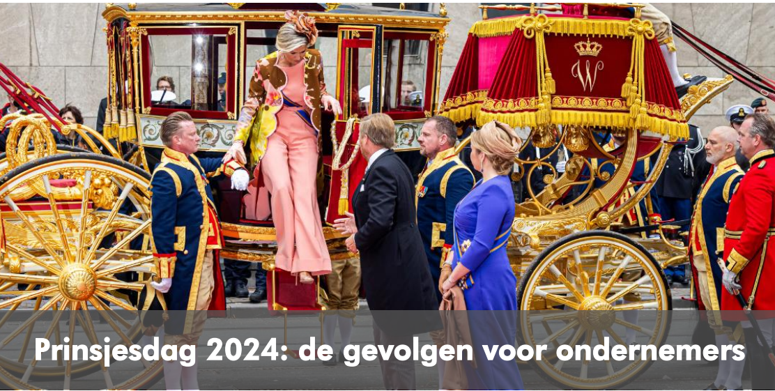
Prinsjesdag 2024: de gevolgen voor ondernemers

Tips voor alle belastingplichtigen, BV's, DGA's, ondernemers, werkgevers en ZZP-ers