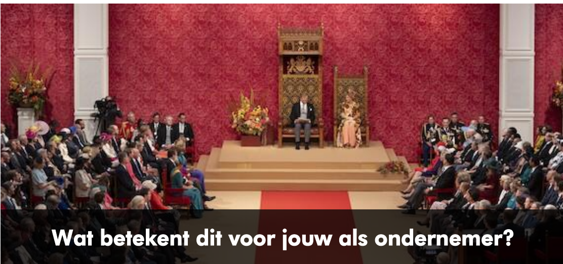
Wat betekent dit voor jouw als ondernemer?