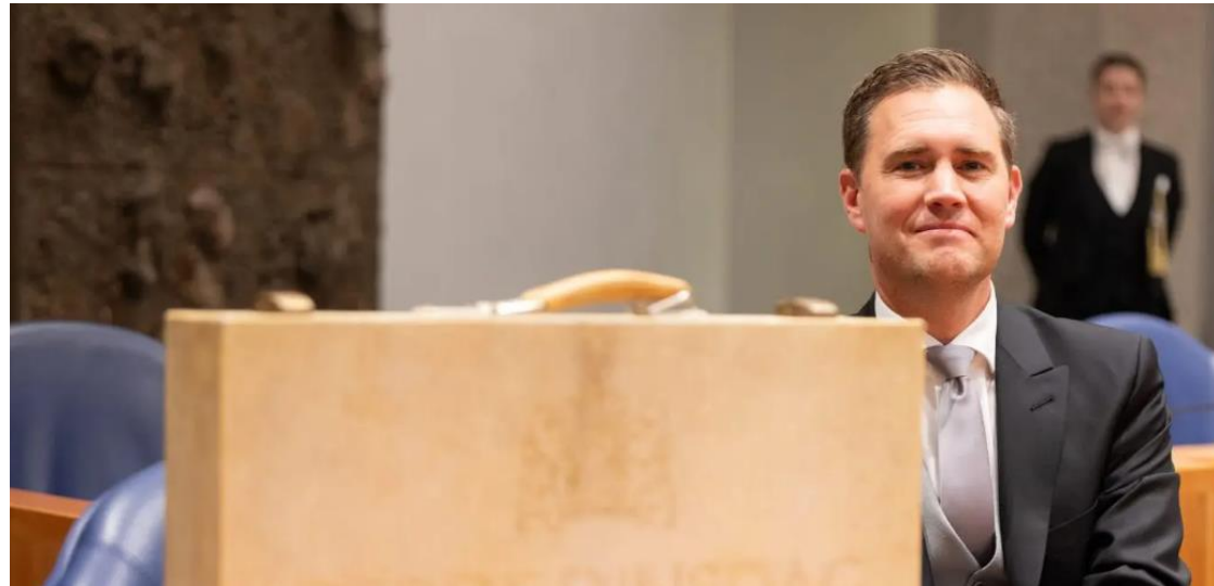
Miljoenennota en de Rijksbegroting 2025